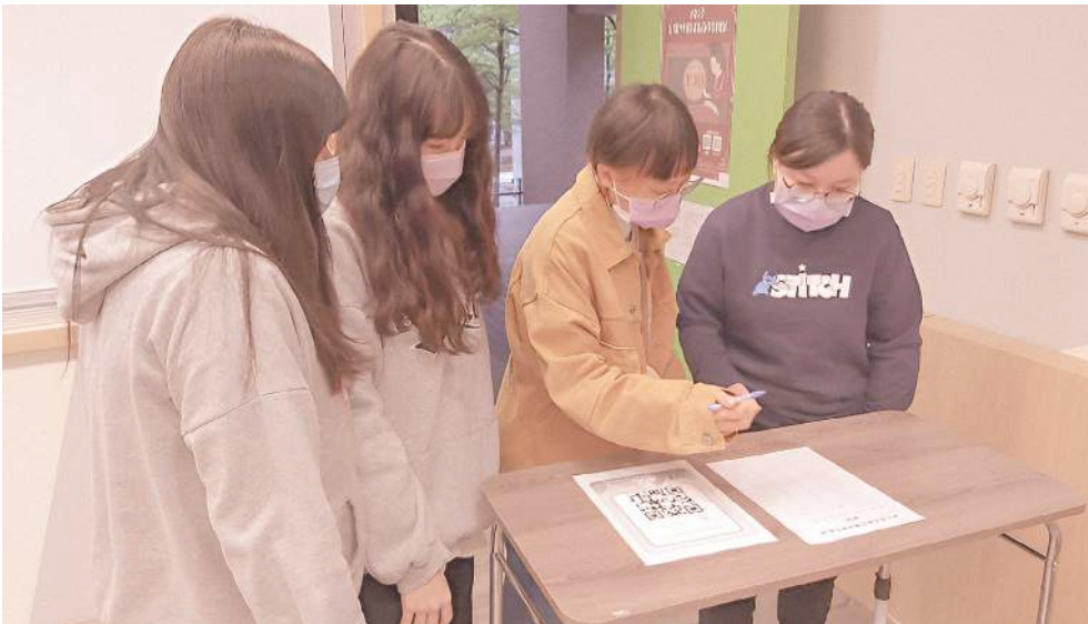
◀ 特殊幼兒評量試教準備