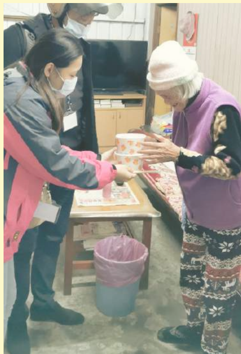
▲ 角聲公益協會關懷長者之送暖活動

餐券補助計畫則是一個同時幫助弱勢家庭又同時振興店家經濟的計畫，角聲當時以「不砍價，先付款」的方式與店家進行合作。對於店家來說這個計畫會讓他們感到溫暖，因為在疫情時大家都很困難的情形下，有人願意幫助他們，更重要的是，也讓他們可以幫助人。後來甚至有一些店家把賺來的錢再捐回去給角聲，讓他們幫助更多有需要的人，因此社會安全網就自然而然地產生了。在餐券補助計畫下，那些家庭除了拿到餐券外，也藉由餐券這個媒介讓角聲的社工們能去瞭解他們家庭的狀況，進而去幫助他們。