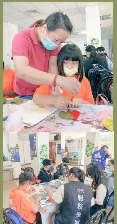
▲（上）製作樹葉帆布包 （下）志工與小朋友們合作創作

活動的第一個項目是利用樹葉沾染顏料，在帆布袋上進行創作，使用的樹葉是來自當地隨處可見的植物，利用落葉進行的環保創作。我們和組員各自手拿一瓶喜好的顏料，隨意的在帆布袋上進行創作，就像回到小時候一般，童稚的氛圍渲染了大家。途中還因為過多的壓克力染料沾在雙手上，因此開始搶奪水槽的菜瓜布，奮力地將雙手清洗乾淨，對話中瞬間快活了起來。