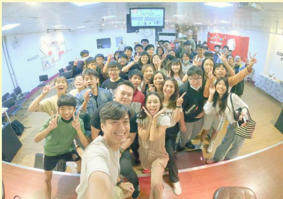
◀ 角聲公益協會大團照

角聲公益協會：融合服務與成長的使命。透過組織的視角，發現在地社區、社會現況內，許多需要被關懷的族群。讓我們透過服務的循環，給予並接受無窮價值。