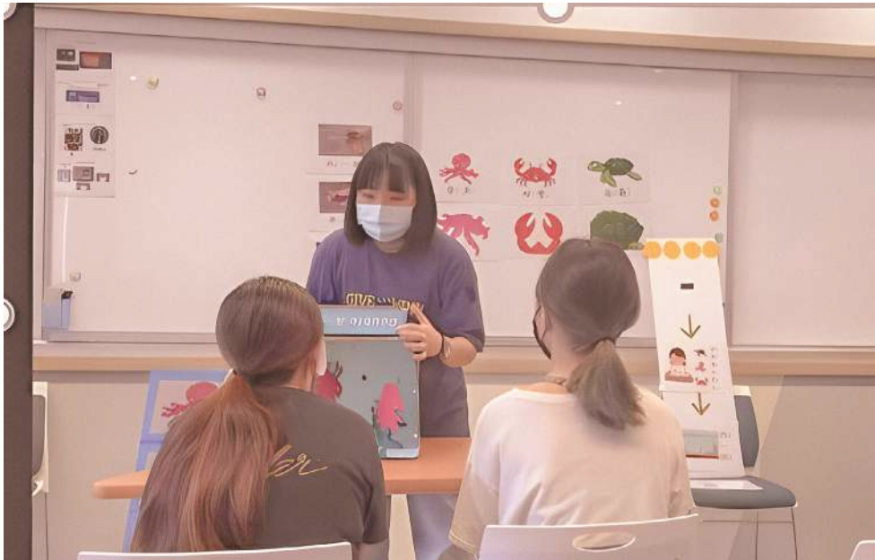
◀ 特殊幼兒評量試教前模擬