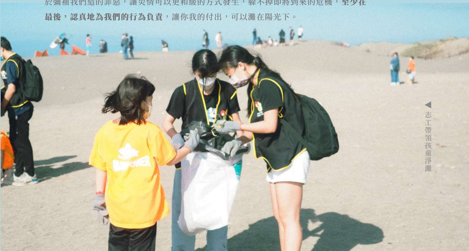
志工帶領孩童淨灘

我曾經單純的認為，只要我吃飯多使用環保餐具，出門多自備購物袋，垃圾多分類讓廢棄物成功進入二次利用，氣候及污染問題就能獲得改善。但事實不然，當時演講中的聽眾在演講結束後詢問了講者：既然都無法阻止災害發生，這樣我們做出環保的意義何在？的確，我心中暗自萌生了放棄環保的念頭。講者對於聽眾這般的言論，他說到：或許污染的迫害已成定局，或許有人會覺得意義不再，但唯有「我們必須負起責任」這點是不變的，災害因你我而起，污染因你我而生，海洋之所以需要由你我保護，目的只在於彌補我們造的罪惡，讓災情可以更和緩的方式發生，躲不掉即將到來的危機，至少在最後，認真地為我們的行為負責，讓你我的付出，可以灘在陽光下。