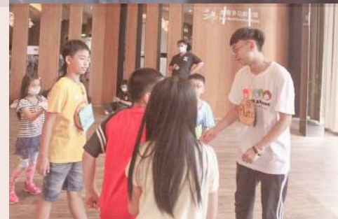
▲ 加入緬甸隊第一個場域服務