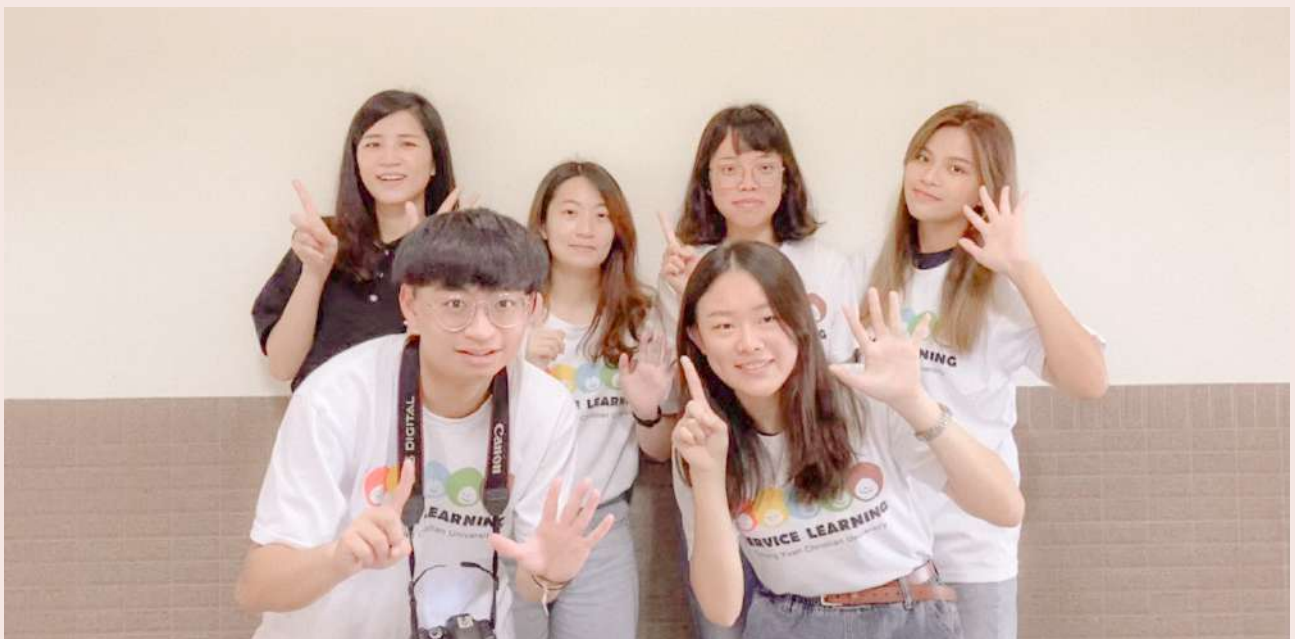
▼ 東 15 班團隊合照

「一個人可以走很快，一群人可以走很遠。」這句話我想獻給所有與我共事過的志工夥伴們，很感激在大學生活中擁有這段經歷。「志工」對我而言沒有高低、沒有貧賤，只有人與人之間最初的溫度。