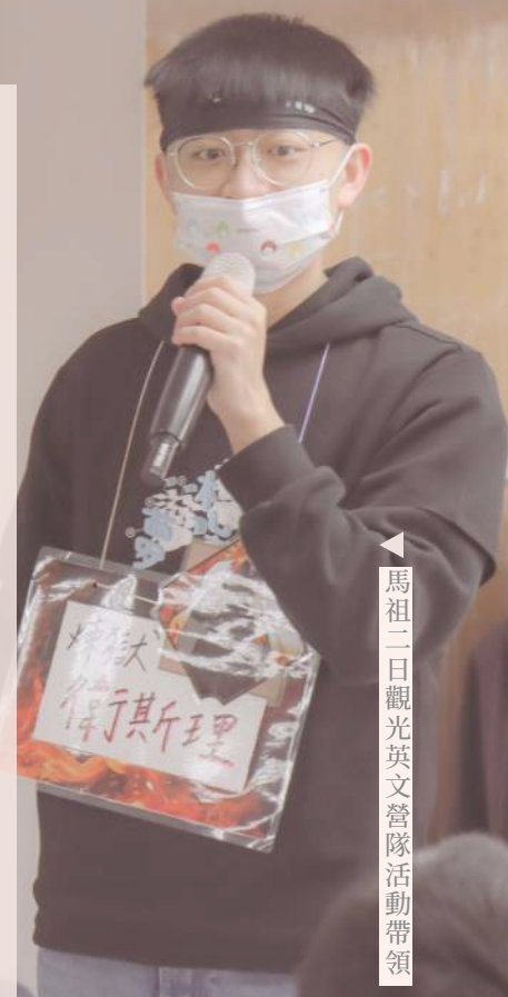
馬祖二日觀光英語營隊活動帶領