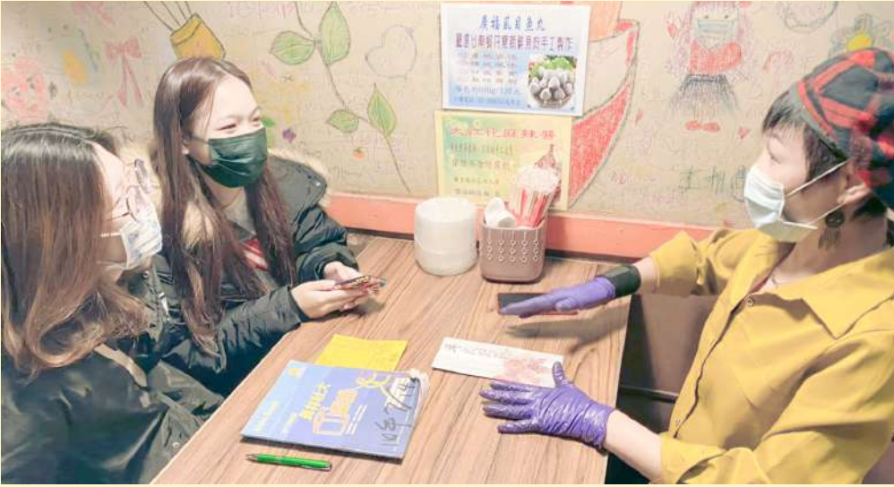
◀ 角聲公益協會志工與店家洽談餐券補助計畫