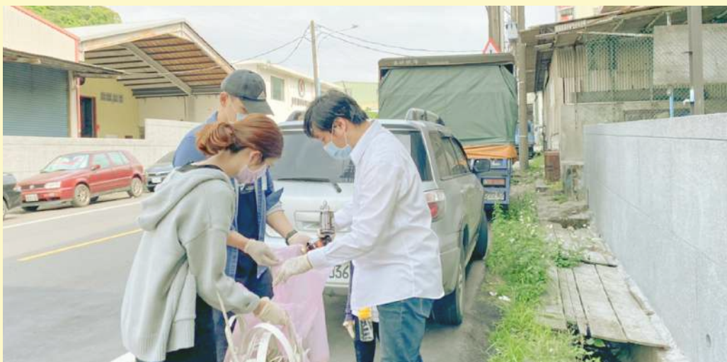
◀ 角聲公益協會協助清掃街道

如果你也認同角聲的理念，歡迎大家一起加入這個大家庭，「你可以相信我；你可以依靠我」。