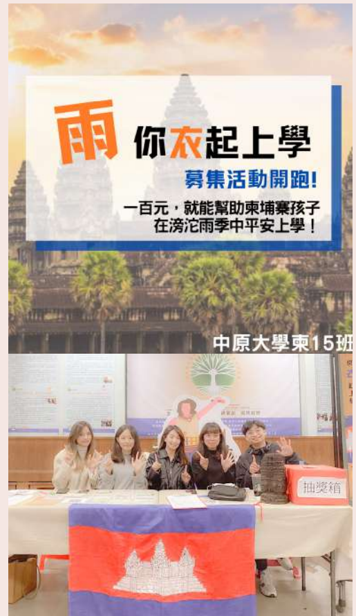
▲ (上) 雨衣募集計畫 Ig 宣傳封面 (下) 雨衣募集計畫擺攤現場

在馬祖服務的準備階段，我們一邊著手進行柬埔寨的服務計畫。無奈疫情仍未趨緩，我們東 15 班遲遲無法看見前往柬埔寨服務的曙光。因此，我們與當地合作組織柬埔寨發展組織（KAKO）進行線上開會，討論今年能調整成什麼方式服務當地，並確保能符合當地服務對象真正的需求。KAKO 告訴我們，柬埔寨的雨季為每年的 5～10 月，面對漫長雨季加上偏鄉道路坑疤泥濘，貧困家庭沒有額外費用能購買雨衣給孩童。孩童僅能以書包遮擋、淋雨到校，感冒了家長也無法負擔高額醫療費，所以雨衣是偏鄉孩童上學的關鍵。東 15 班決定趕在雨季來臨前為柬埔寨孩童募資雨衣。因此，我們在學校裡發起「雨」你「衣」起上學—雨衣募集計畫，在真知教學大學舉行一週的擺攤募資，接受小額捐款及二手雨衣募資，只要募資即贈送柬埔寨孩童手繪的明信片當作回饋。我們也透過傳單、FB 和 IG 持續進行宣傳，增加曝光率。在擺攤期間更詳細地向每位來捐款的善心人士介紹服務地的背景和需求。最終共募得新台幣 56,570 元及二手雨衣 12 件！在擺攤短短一週和在校同學間的交流也讓我看到和學習到很多不同的事物。校園的溫暖、人的溫暖，這些交流都讓我感觸很深。