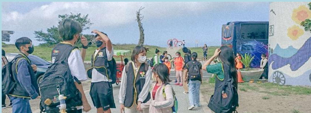
帶領小隊前去淨灘